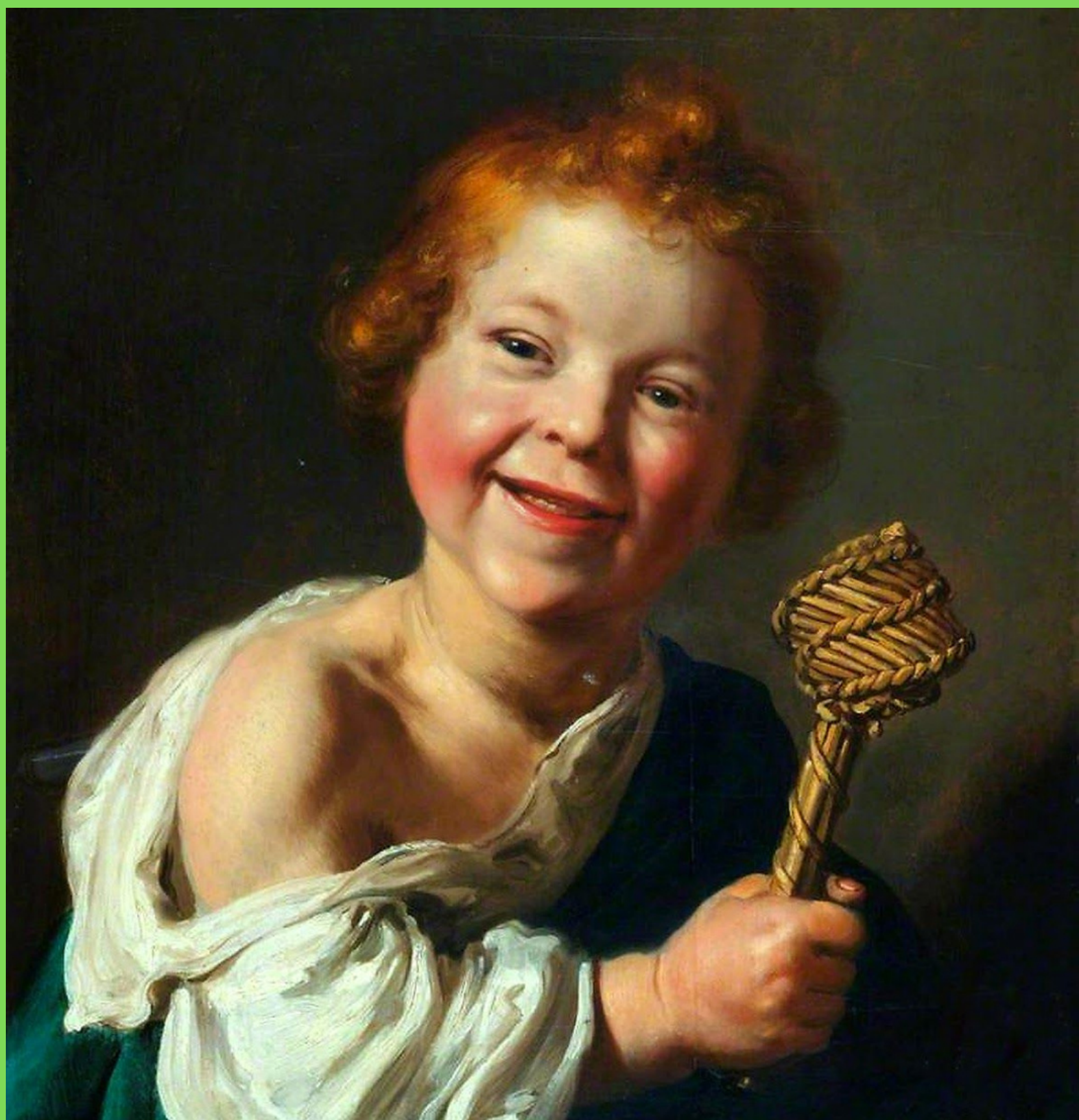
Саламон де Брэй "Портрет ребенка"