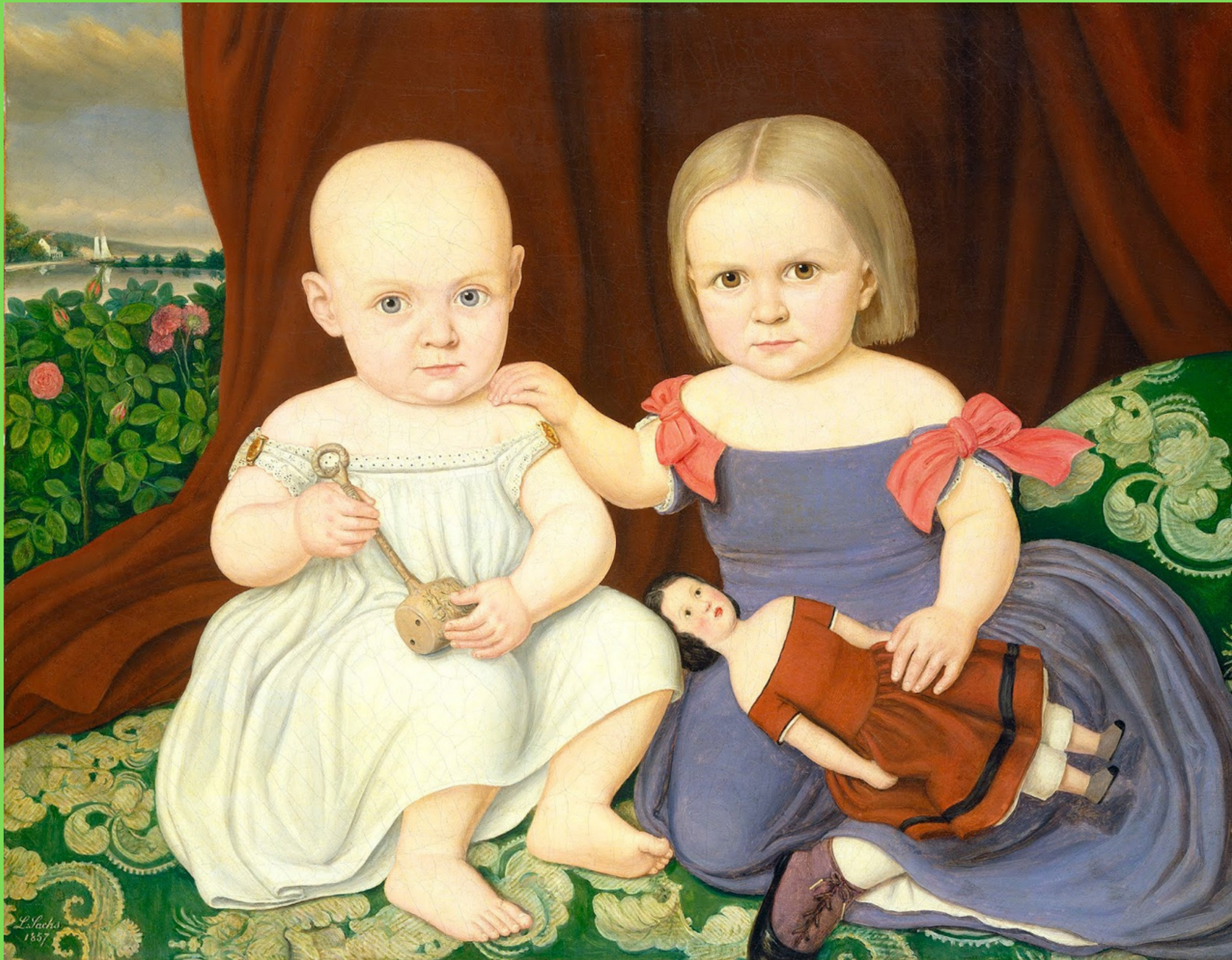
Сакс, Ламберт - Дети Герберт (картина) - Национальная