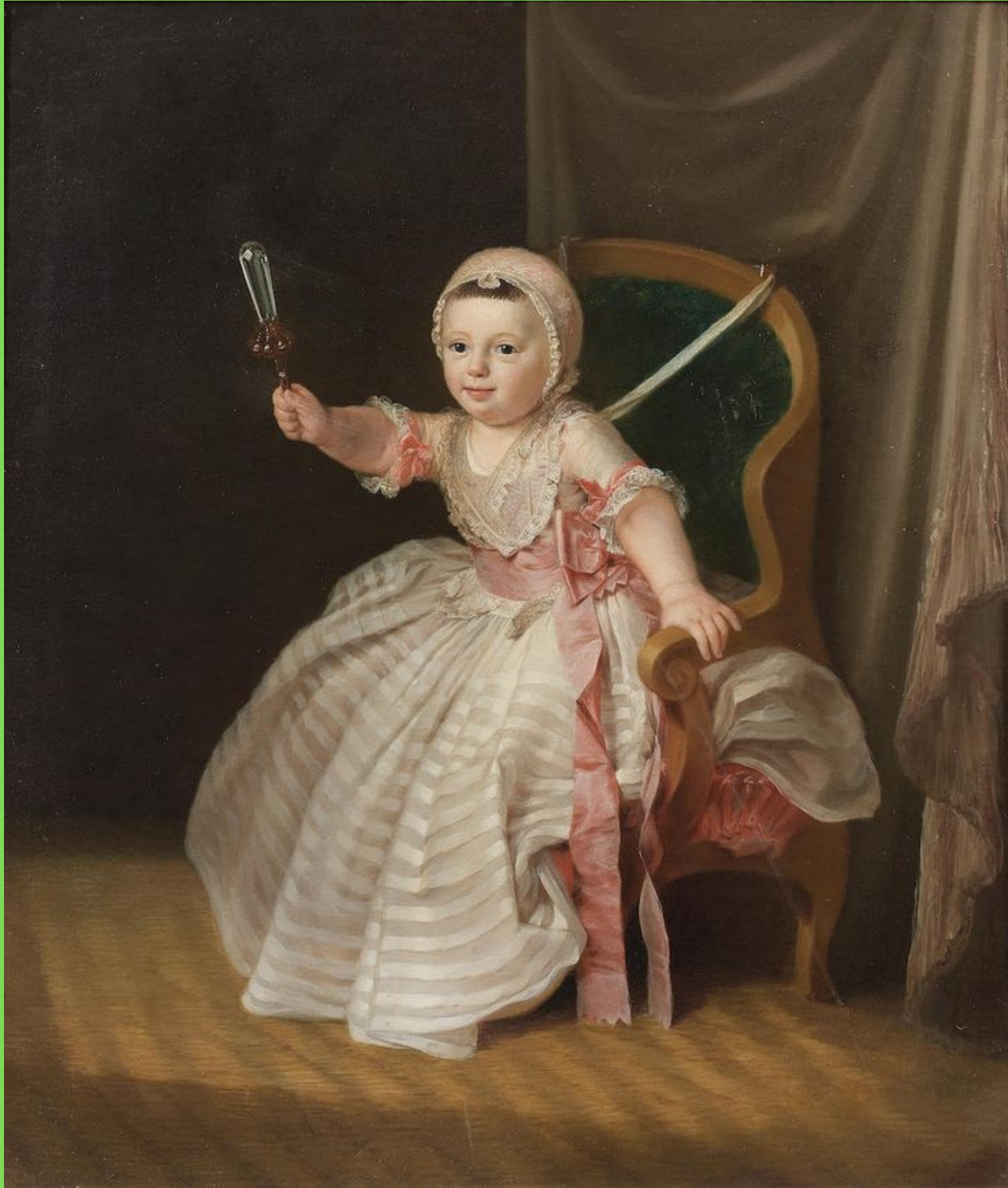
Портрет ребенка с погремушкой в руках Нильс Роде (Niels Rode)