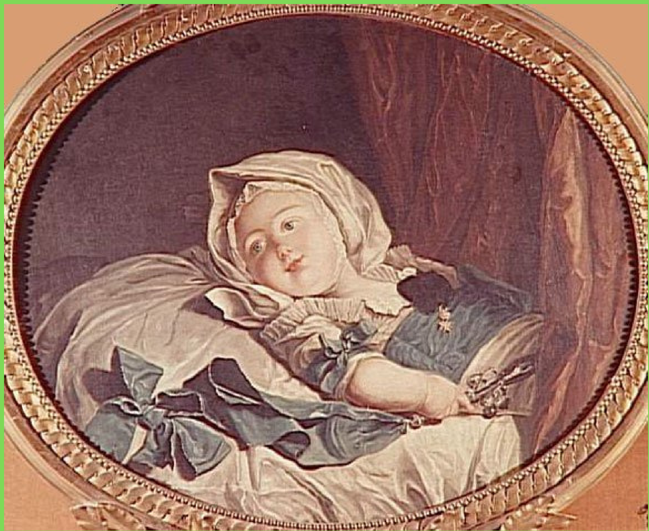
Принц Луи Антуан де Бурбон, герцог Ангулемский, 1776.