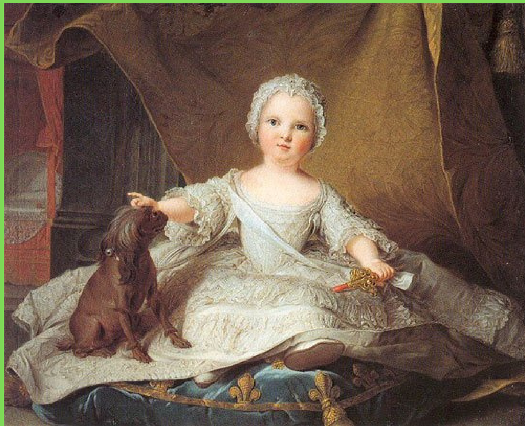
Портрет принцессы Мари Зефирины Французской Жан-Марк Натье (1685–1766)