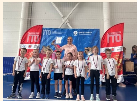
Фото-отчет: участия детей

Команда заняла 2 место среди других садов, детей из подготовительных групп по Приморскому району