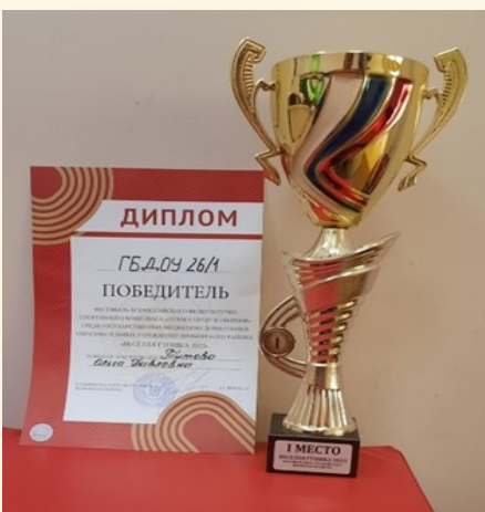
Фото-отчет: участия детей в ГТО на площадке Центра спорта Газпрома.

Участие детей из 8 человек в командной «Веселой ГТОшке 2023»: на базе Газпрома