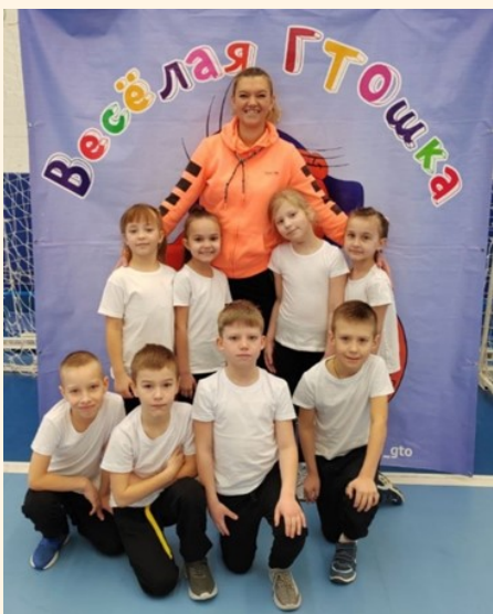
Фото-отчет: участия детей в ГТО на площадке Центра спорта Газпрома.

Команда заняла 1 место среди других садов, детей из подготовительных групп по Приморскому району.